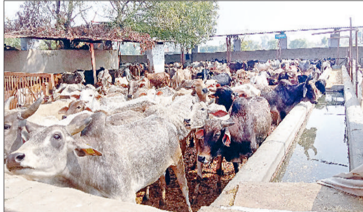
नारनौल। गोशाला के बाड़े में बंद गायें।

गौर हो कि प्रदेश सरकार द्वारा गोशालाओं में रखी गई गायों के भरण-पोषण के लिए अनुदान का प्रावधान है। इसमें बछड़ा-बछड़ी के लिए 10 रुपये, गाय के लिए 20 रुपये एवं नंदी (सांड) के लिए 25 रुपये प्रतिदिन के हिसाब से देने का नियम है, लेकिन एक अप्रैल से अब तक यह राशि नहीं आई है, जिससे गोशाला संचालकों को भारी परेशानी हो रही है। इससे जिले की गोशालाओं की हालत ख़ासी खराब हो गई है। उल्लेखनीय है कि महेंद्रगढ़ जिले में करीब 30 गोशालाएं संचालित हो रही हैं, जिनमें लगभग 17,000 गायें, सांड और बछड़े रखे गए हैं। यह पशुचारा अनुदान न मिलने की स्थिति में किसी भी गोशाला संचालकों को भारी परेशानी हो गया है। यह अनुदान नहीं मिलने से गोशालाओं के संचालक परेशान नजर आते हैं। उनका कहना है कि सरकार द्वारा मिलने वाला यह अनुदान उनके लिए जीवनरेखा की तरह है। चारे और अन्य जरूरी सामान की खरीद के लिए इसी राशि पर निर्भर रहते थे, लेकिन जब से पैसा बंद हुआ है, तबसे गोशालाओं में रखी गायों को