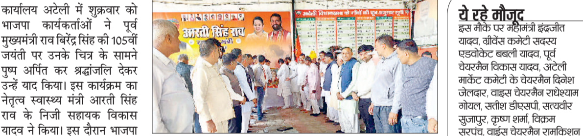
मंडी अटेली। राव बिरेंद्र सिंह की जयंती पर पुष्प अर्पित करते हुए।

स्वास्थ्य मंत्री के कार्यालय पर आयोजित हुआ कार्यक्रम